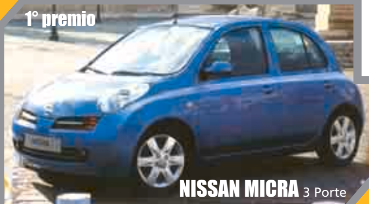
NISSAN MICRA 3 Porte